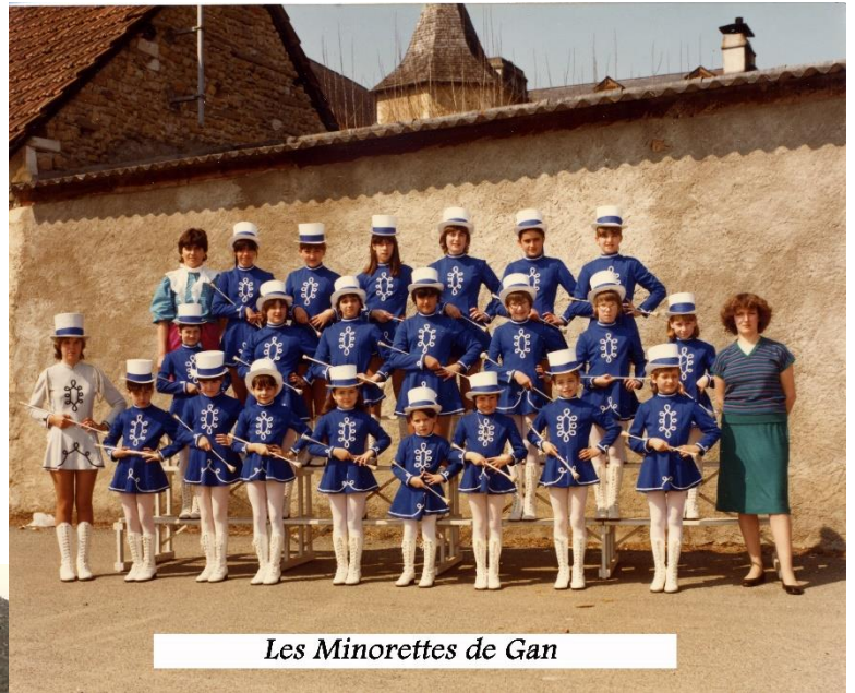
Les Minorettes de Gan