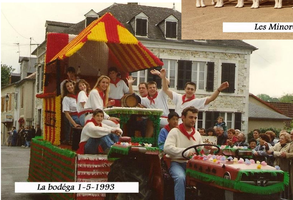
La bodéga 1-5-1993