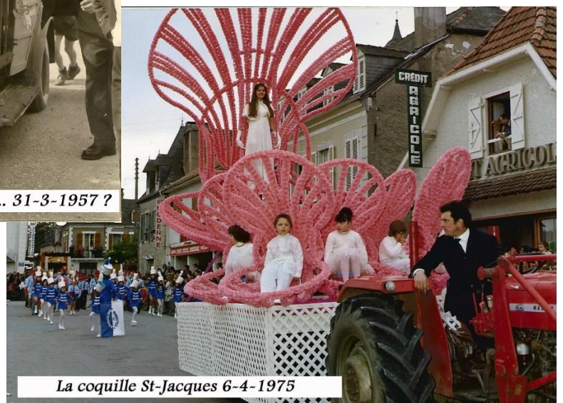
La coquille St-Jacques 6-4-1975