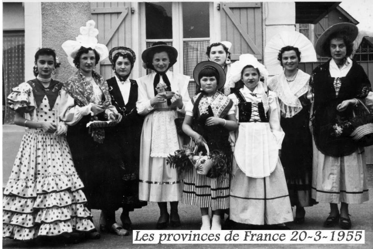
Les provinces de France 20-3-1955