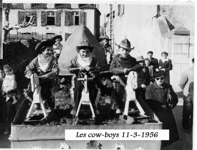
Les cow-boys 11-3-1956