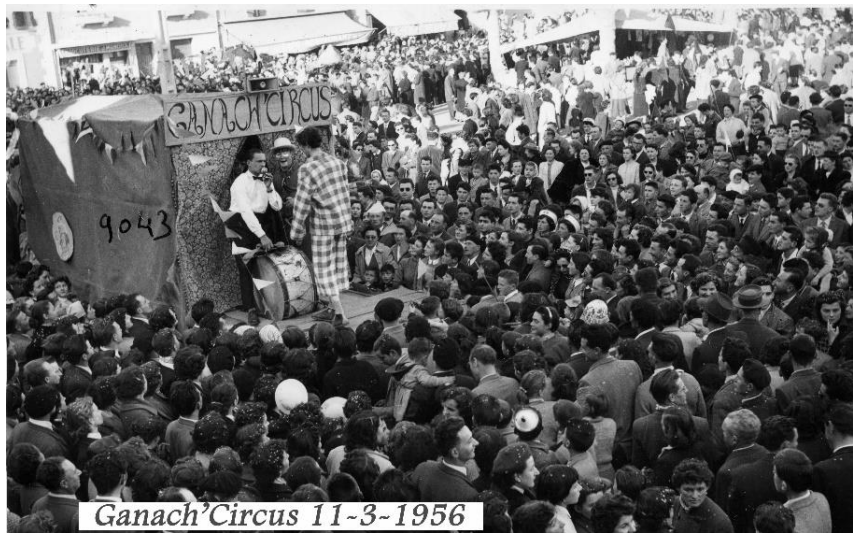
Ganach' Circus 11-3-1956