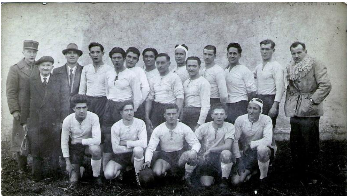
Match Gan-Laruns (5-3) le 10 février 1946.

L'équipe de rugby est créée et engagée dans le Challenge Plàa organisé par le Comité de Béarn. La première poule de ce challenge comprend les équipes de Laruns, Bénéjacq, l'ASOP (Association Sportive Ouvrière Paloise) et Gan. Le premier match a lieu le 10 février 1946 à Laruns et Gan l'emporte sur Laruns sur le score étriqué de 5 à 3.