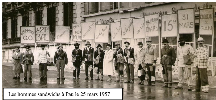
Les hommes sandwichs à Pau le 25 mars 1957

Avant et après le défilé du corso des chars, ainsi qu'en soirée le bal bat son plein.